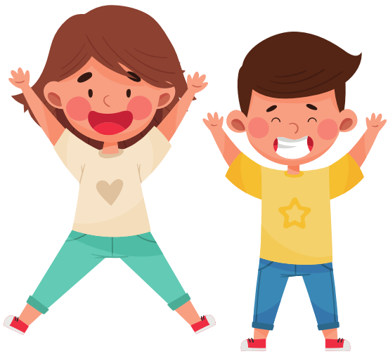
SALTO BRACCIA E GAMBE APERTE