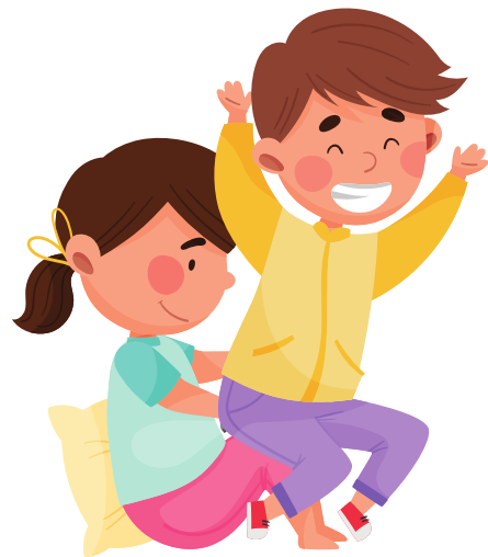
SEDUTO SUL COMPAGNO