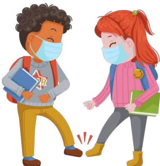
PUNTA CONTRO PUNTA