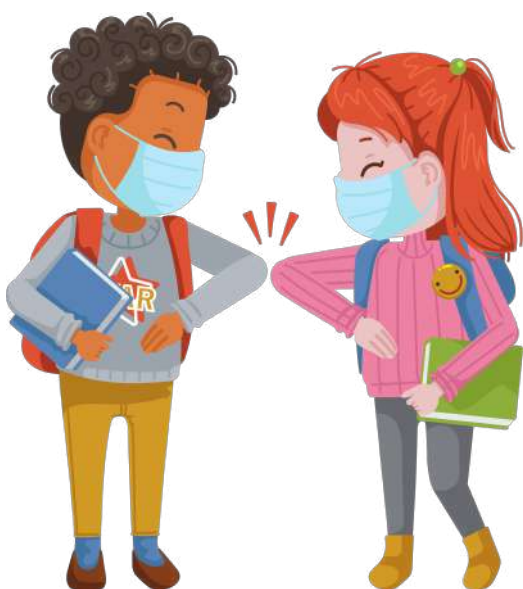
GOMITO CON GOMITO