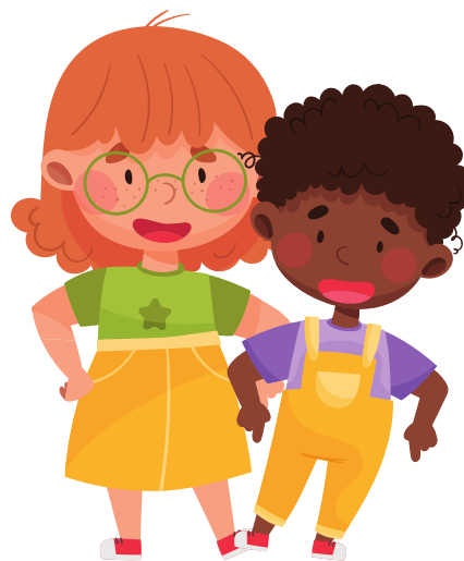
PIEDE CONTRO PIEDE