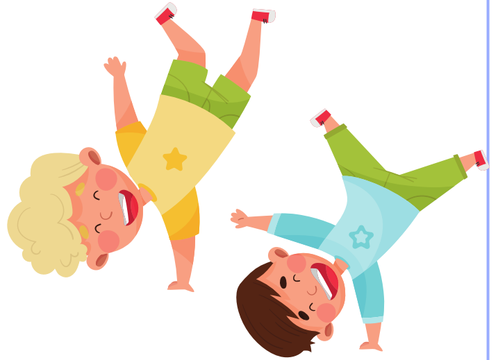
SALTO CON UNA MANO A TERRA