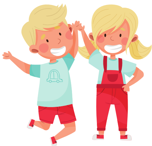
BATTI IL CINQUE