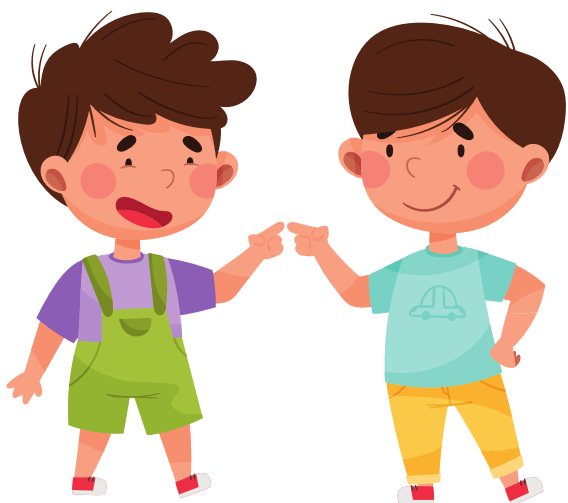
DITO CONTRO DITO