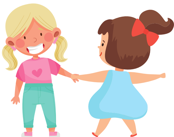
STRETTA DI MANO