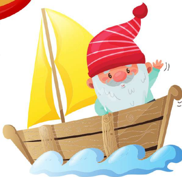
ANDARE IN BARCA