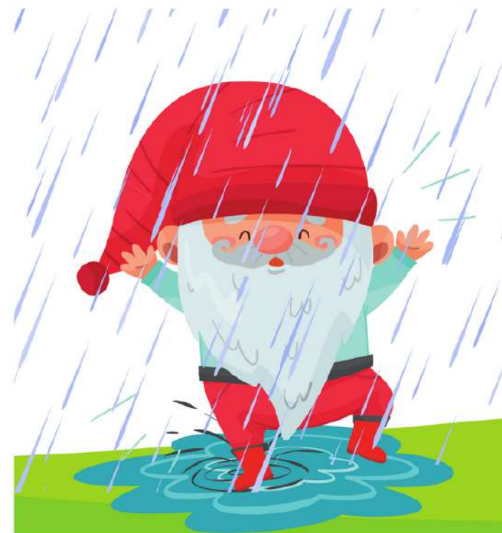
SALTARE NELLE POZZANGHERE