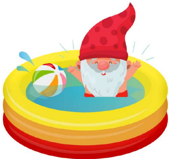
NUOTARE IN PISCINA